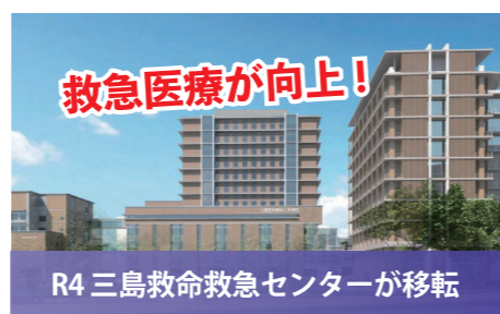
R4 三島救命救急センターが移転 三次救急機能を大阪医科薬科大学病院に移転 高度な施設、各専門医で質の高い医療を提供