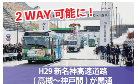
H29 新名神高速道路 (高槻～神戸間)が開通 市街地近くに高槻JCT・ICが整備 新名神と名神のどちらにもアクセス可能