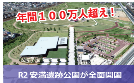
R2 安満遺跡公園が全面開園 甲子園球場5個分の広さ 国宝級の史跡安満遺跡 114万人が来園(R4年4月～12月)