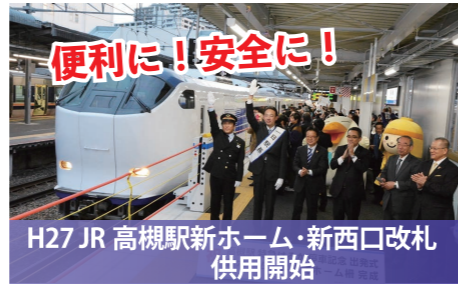
H27 JR 高槻駅新ホーム・新西口改札 供用開始 特急「はるか」「サンダーバード」停車 JR 西日本管内初の昇降式ホーム柵設置

保育所等の施設・定員数 (H23比) 施設約 2倍(52増) 定員約 1.4倍(1,876増)